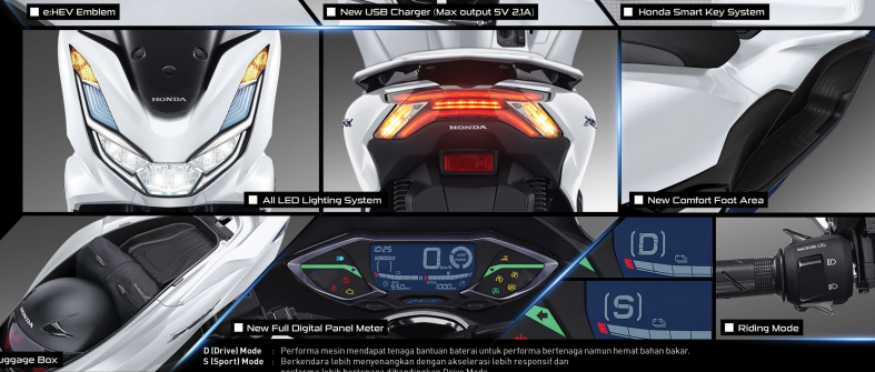
■ e-HEV Emblem ■ New USB Charger (Max output 5V 2.1A) ■ Honda Smart Key System

Teknologi ini didukung oleh baterai Lithium-Ion yang menghasilkan akselerasi lebih responsif saat tuas gas diputar secara spontan untuk memberikan kenikmatan berkendara di segala situasi.